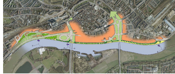
Zie http://www arnhem.nl klik op "over de stad", "projecten" en vervolgens "lage kade"

plek voor historische schepen onder de aandacht gebracht.