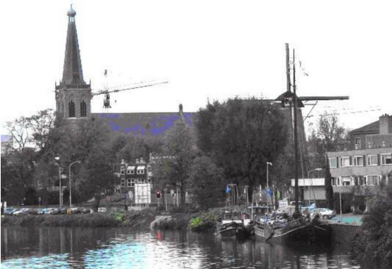
Schepencarrousel in Doetinchem: het afmaken van het plaatje

De schepencarrousel is een systeem waarbinnen schepen (zoals sleepboten, vrachtschepen en zeilschepen) uitgewisseld worden tussen ligplaatsen. De schepen liggen voor een korte periode (max. 3 maanden) op een ligplaats. Op de ligplaats presenteren de schepen en schippers het verhaal van het schip en de cultuurhistorie van de scheepvaart, door middel van onder andere informatieborden. Er wordt duidelijk gemaakt waar en waarom het schip gebouwd is, wat het zoal heeft beleefd in de loop van de tijd en waarom bepaalde aanpassingen gedaan zijn.