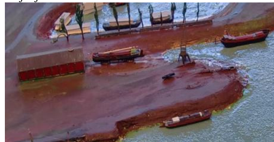
Makette met impressie van de nieuwe ASM-werf

Het initiatief voor een werkplaats met helling ligt al enige tijd stil omdat de grondeigenaar niet toestaat dat er bodemonderzoek gedaan wordt. Dit is erg jammer. Vanuit de gemeente wordt er sterk gelobbyd om tijdelijke activiteiten op de stadsblokken toe te staan. We hopen dat dit initiatief een vervolg kan hebben. Wij zijn er klaar voor!